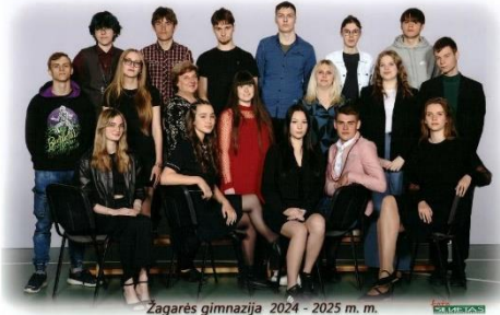
Zagarės gimnazija 2024 - 2025 m. m.